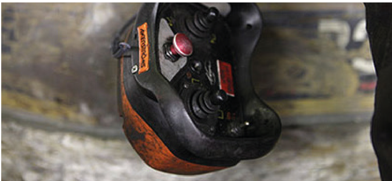
Åkerströms Björbo utvecklar, producerar, marknadsför och servar produkter och system för radiostyrning av industrikranar, mobila applikationer, portar och lok som klarar av mycket tuffa driftmiljöer.

Smarteq deltar löpande i industrinära forskningsprogram för att tidigt utveckla antennlösningar för morgondagens